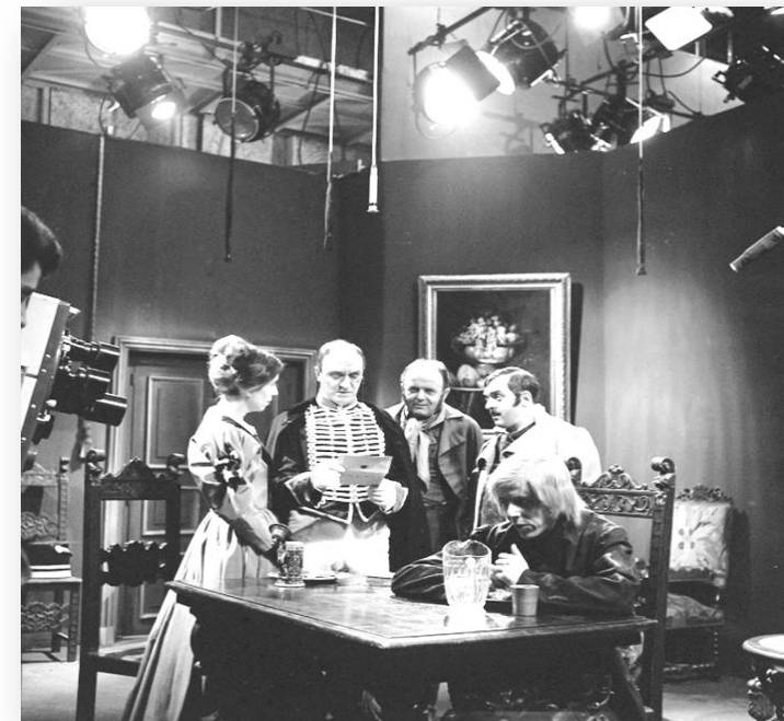
© Photo : Daniel Fallot, 1958 Plateau tournage Gaspard Hauser, l'orphelin de l'Europe