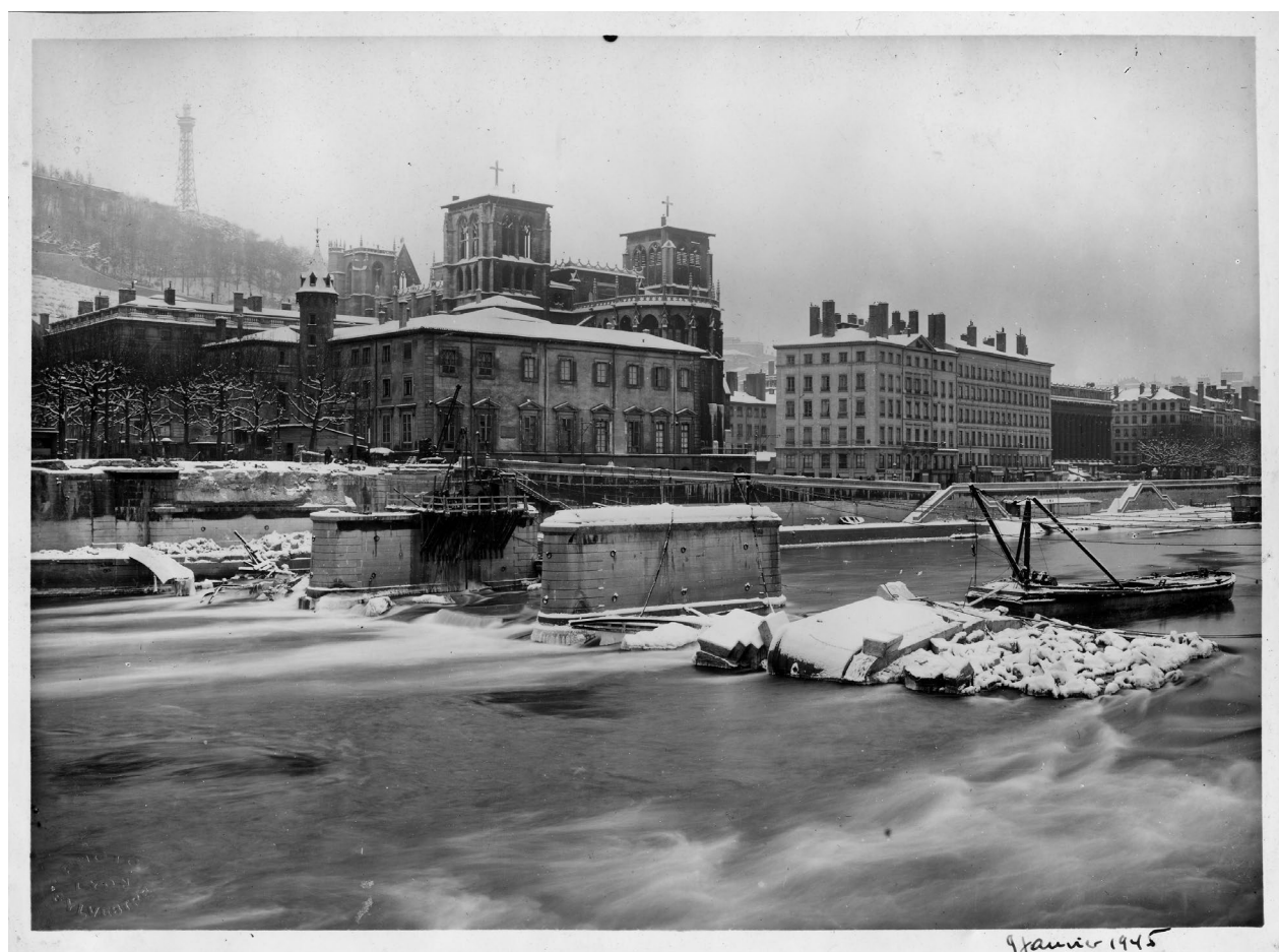
Pont Tilsitt, 9 janvier 1945 (Arch. dép. Rhône, 3683 W NC)