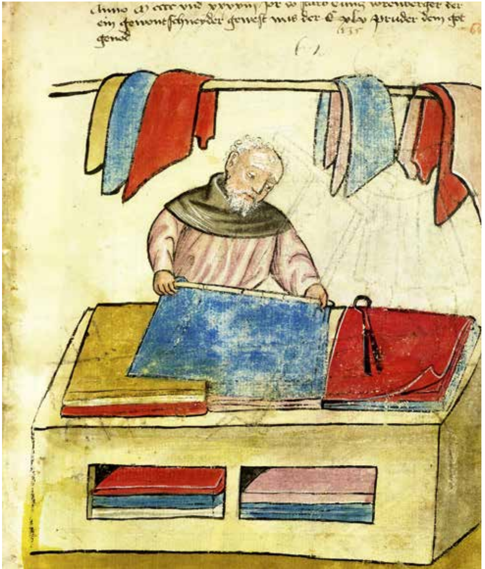
Vendeur de draps