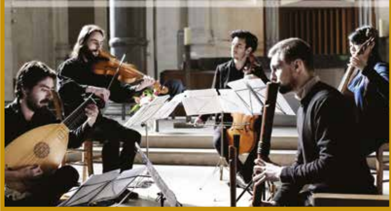
© La Quinta Pars, voyage musical dans le temps