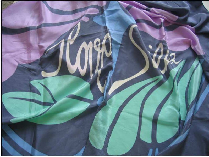
Foulard publicitaire « I love silk »