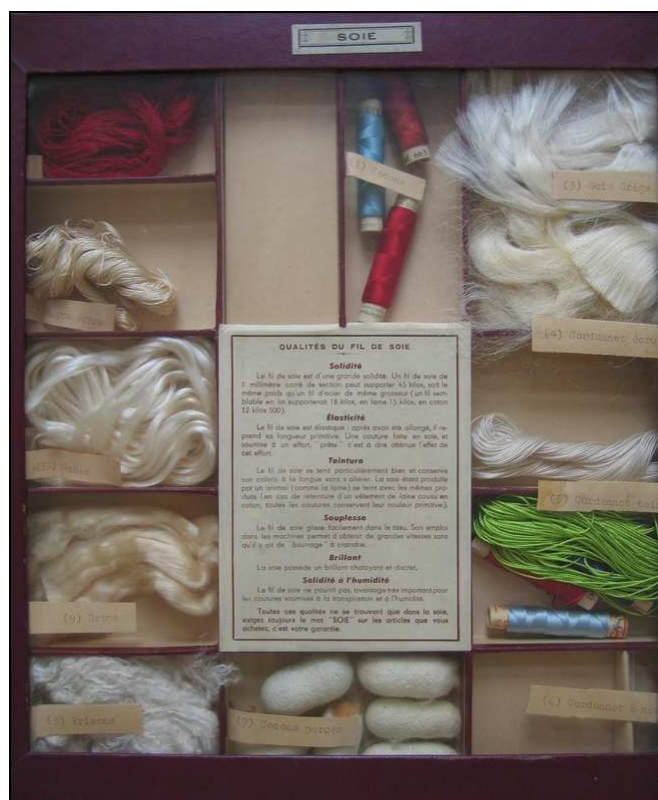
Tableau pédagogique à casiers