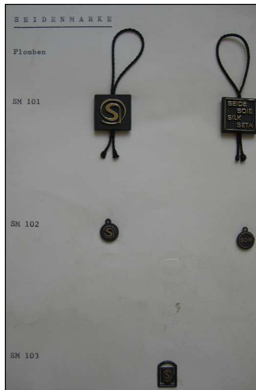
Marque Soie, monogramme « S » : sceaux