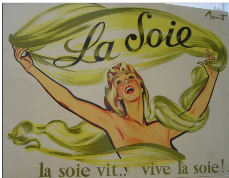
Affiche de propagande française