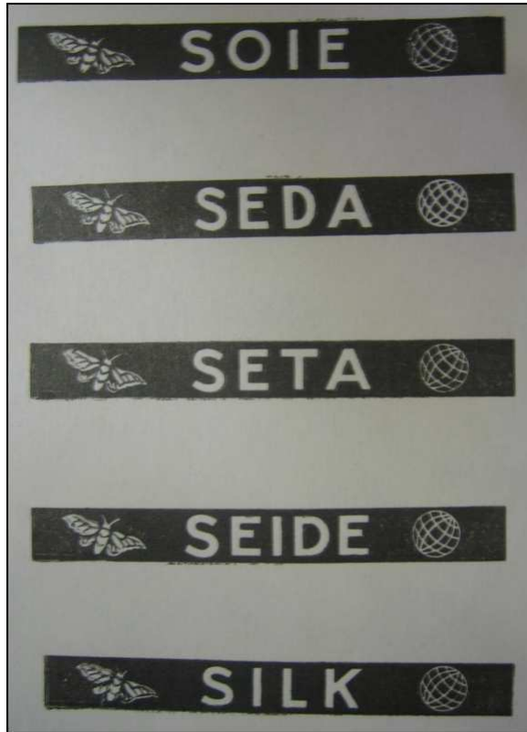
Marque Soie cinq langues séparées