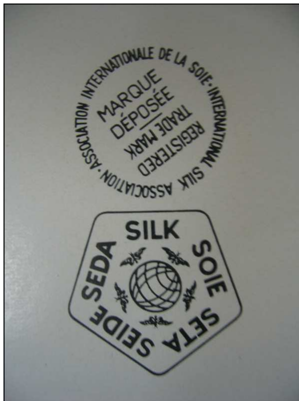
Marque Soie cinq langues réunies