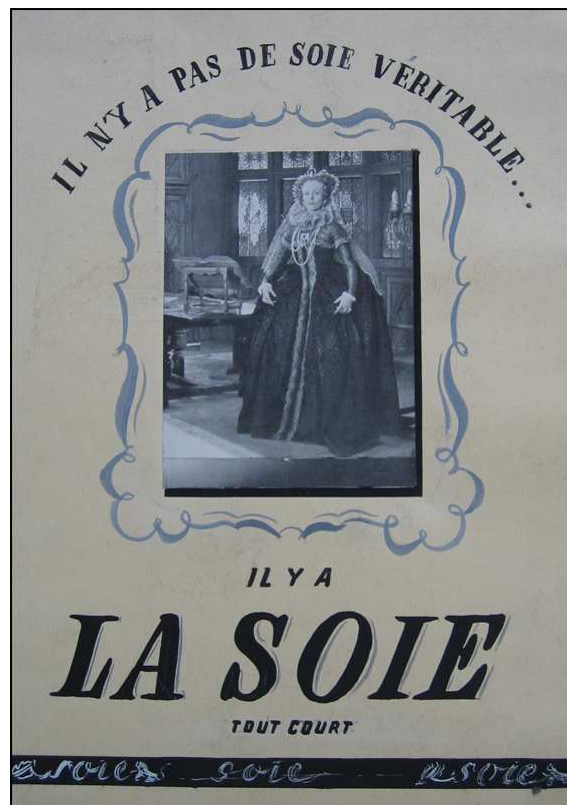
Affiche publicitaire pour la marque fédérative soie