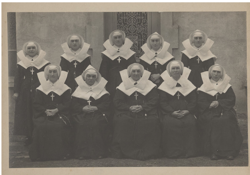
Religieuses de l'hôpital de Saint-Symphorien-sur-Coise, vers 1950. HDEPOT SSC K1

Le fonds étant en cours de classement, le bordereau de versement des archives détaillées à la pièce est consultable en pièce jointe et l'accès se fait sur demande préalable.