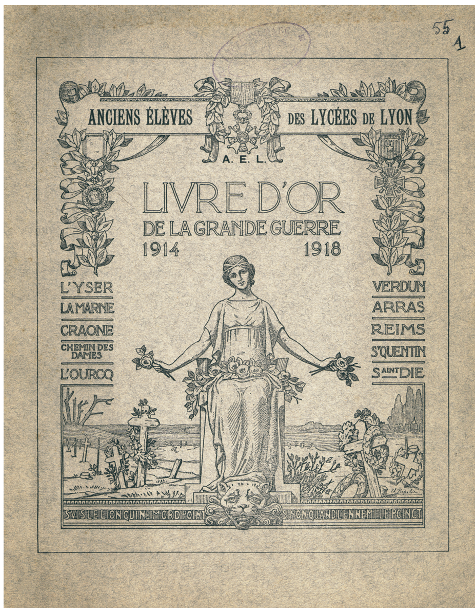
Livre d'Or de la Guerre 1914-1918, 1921 (1 T 2618)