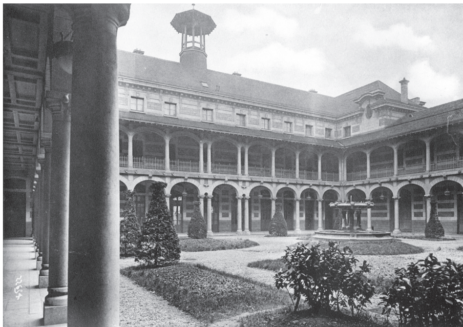
Cour d'honneur du lycée du Parc, s.d. (collection particulière)

Photographe : David et Vallois, 23 rue Gustave Rey 92250 La Garenne Colombes