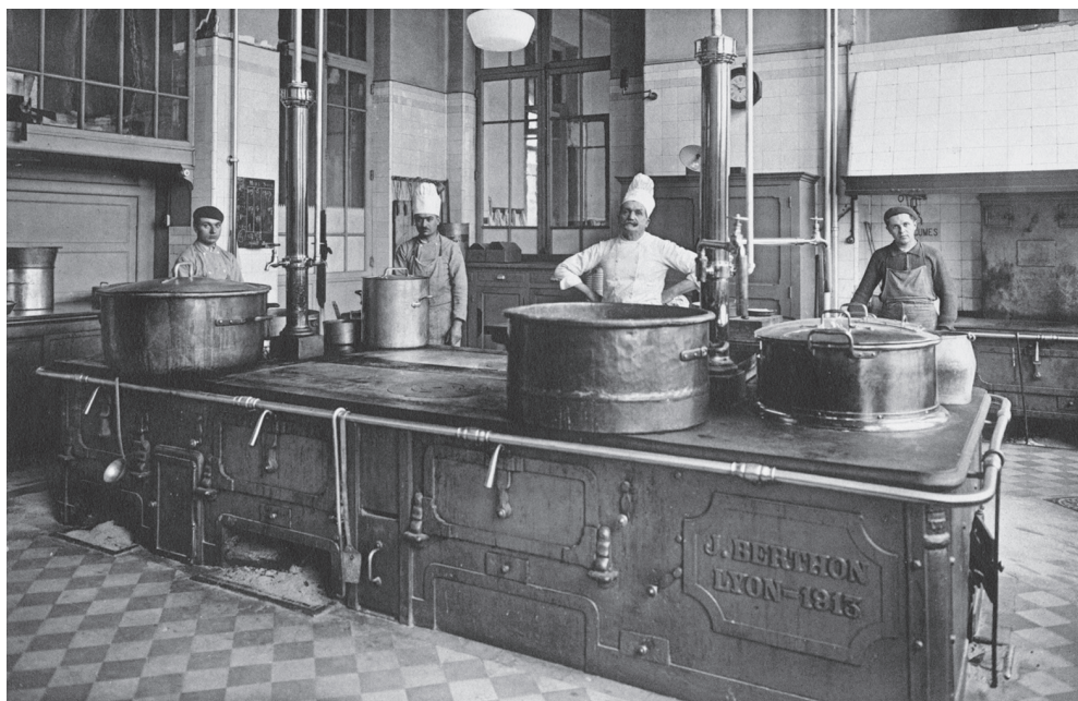
Cuisine du lycée du Parc, s.d. (collection particulière)

Photographe : David et Vallois, 23 rue Gustave Rey 92250 La Garenne Colombes