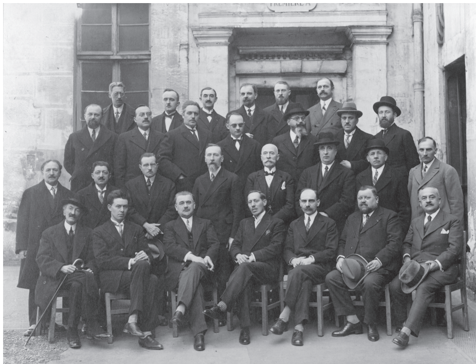
Congrès des censeurs, avril 1931 (1 T 2634)