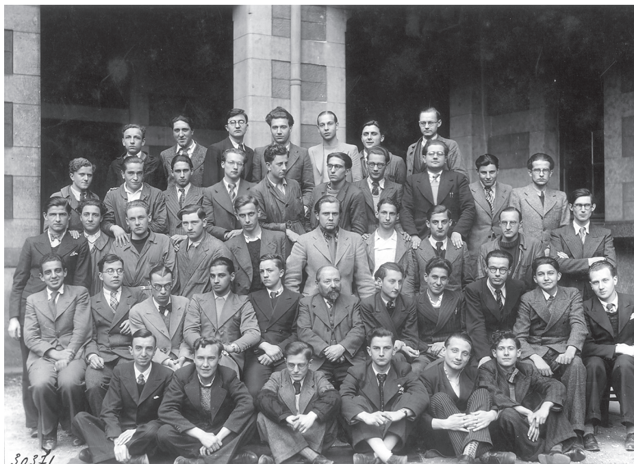
Classe de philo, 1936-1937 (I T 2635)