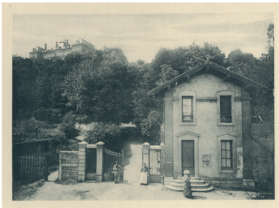
Entrée du lycée annexe de Saint-Rambert, s.d. (1 T 2624)