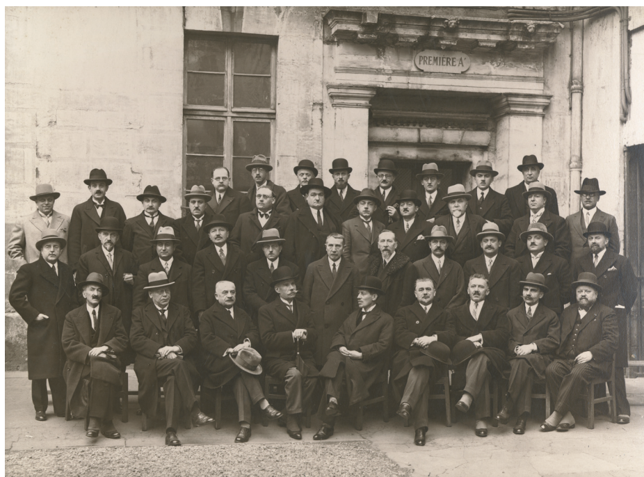
Professeurs du lycée du Parc, s.d. (I T 2639)