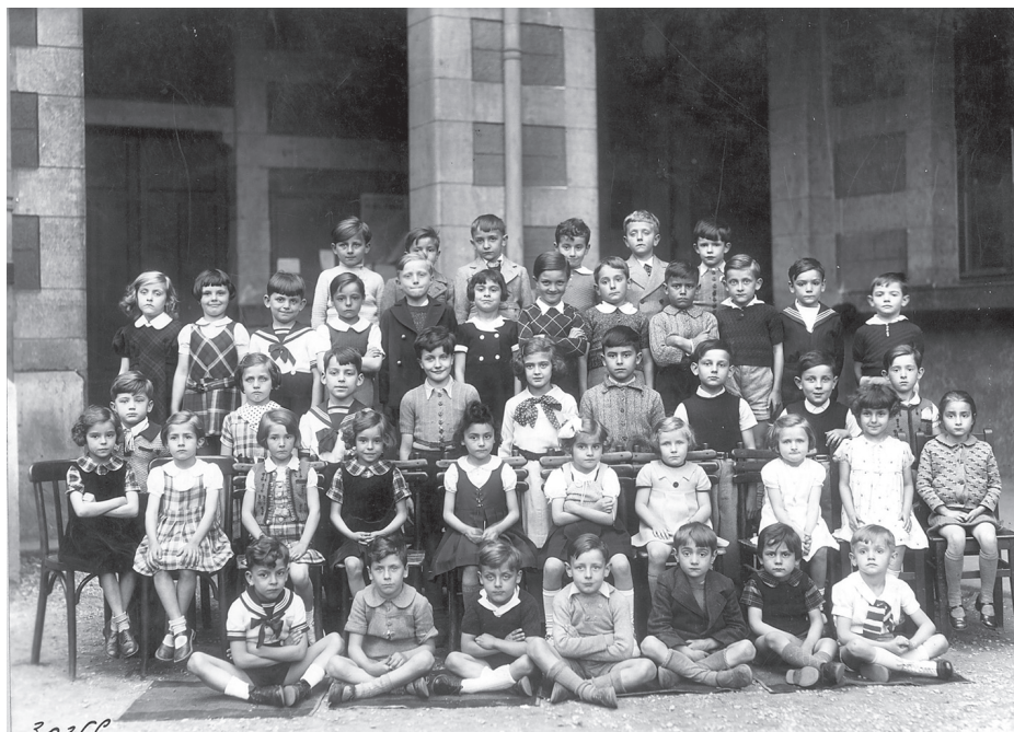
Classe enfantine, 1936-1937 (1 T 2635)