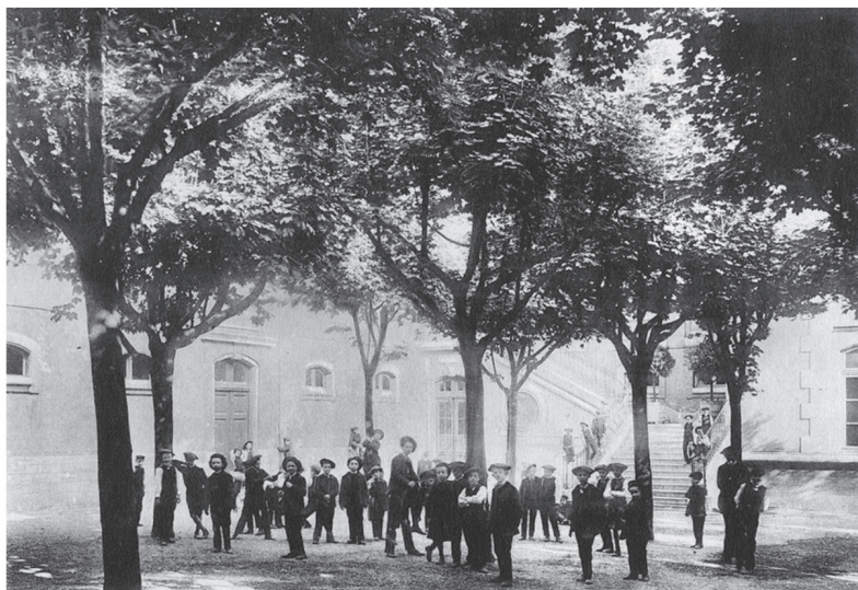
Façade et cour du Lycée annexe de Saint-Rambert, s.d. (1 T 2624)