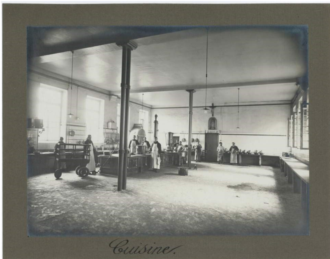
Crédit photo : Archives de l'Ordre de Saint-Jean-de-Dieu, les cuisines, 1925.