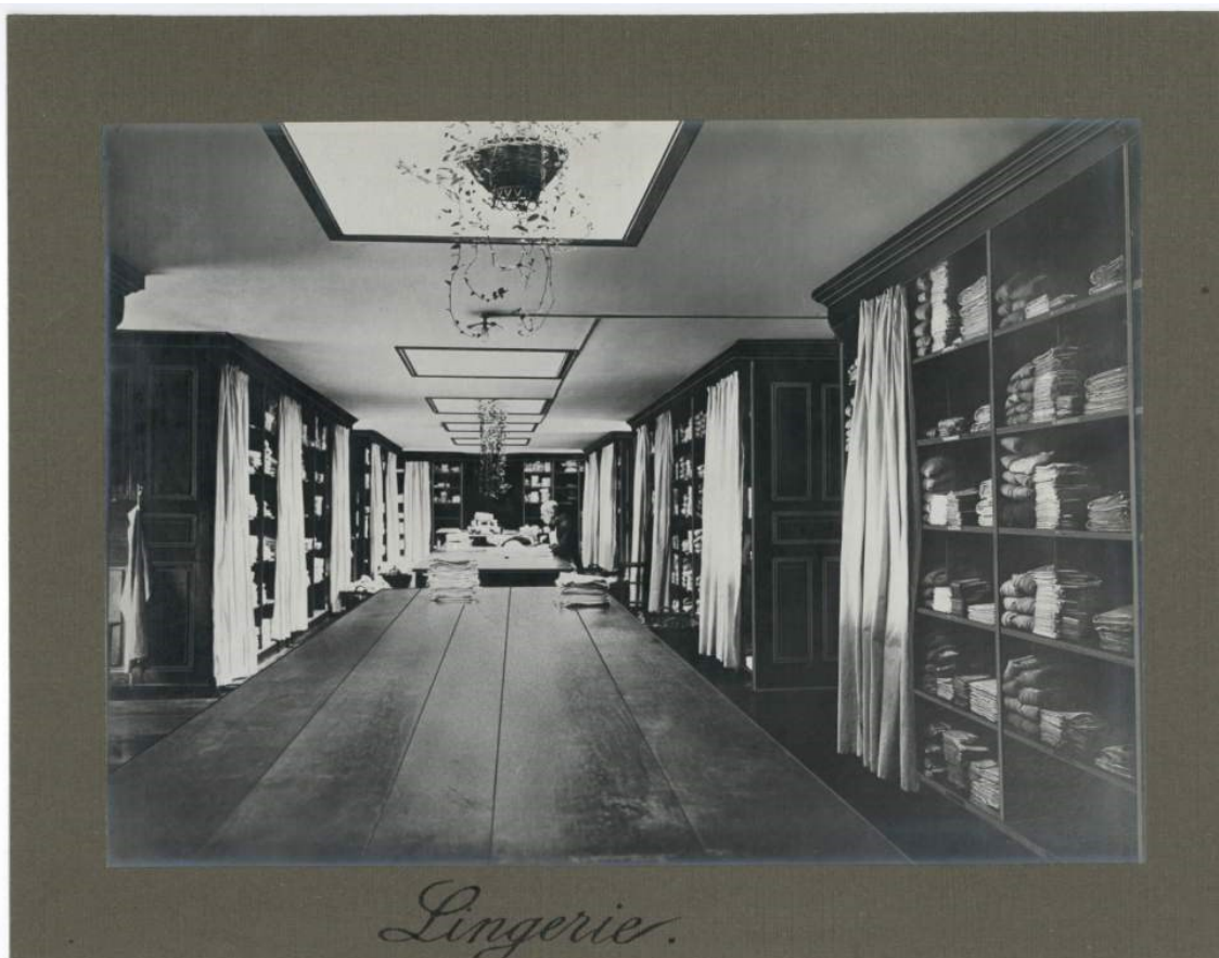
Crédit photo : Archives de l'Ordre de Saint-Jean-de-Dieu, la lingerie, 1925.

HDEPOT/SJDD P 12 Produits et fournitures de la ferme, entrées et sorties : journaux mensuels des recettes et des dépenses.