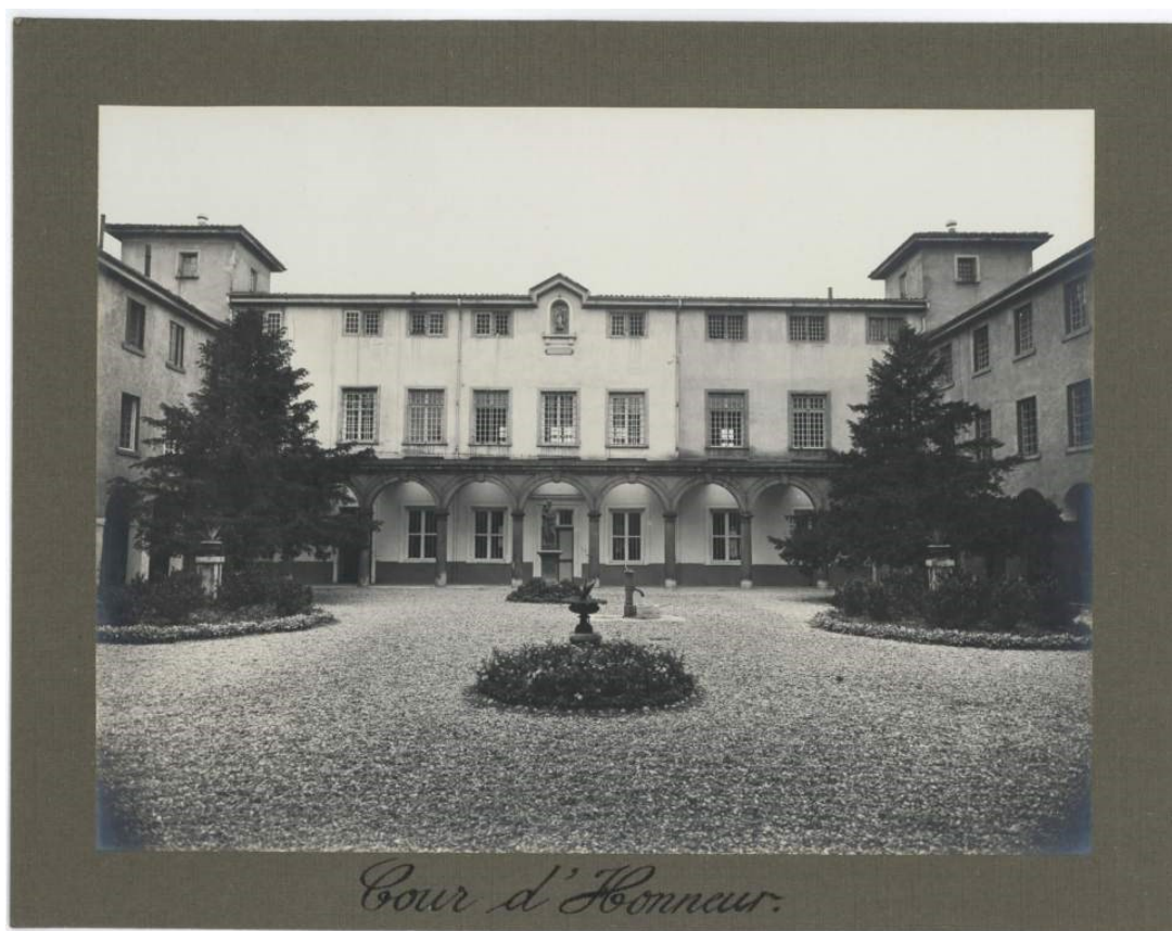
cour d'honneur, 1925.

Ces affaires de contentieux concernent les pensionnaires dont les frais d'hospitalisation n'ont pas été réglés et l'envoi de correspondance par les familles ayant des difficultés à régler les frais et dépenses. (Voir Annexes pour les noms des parties).