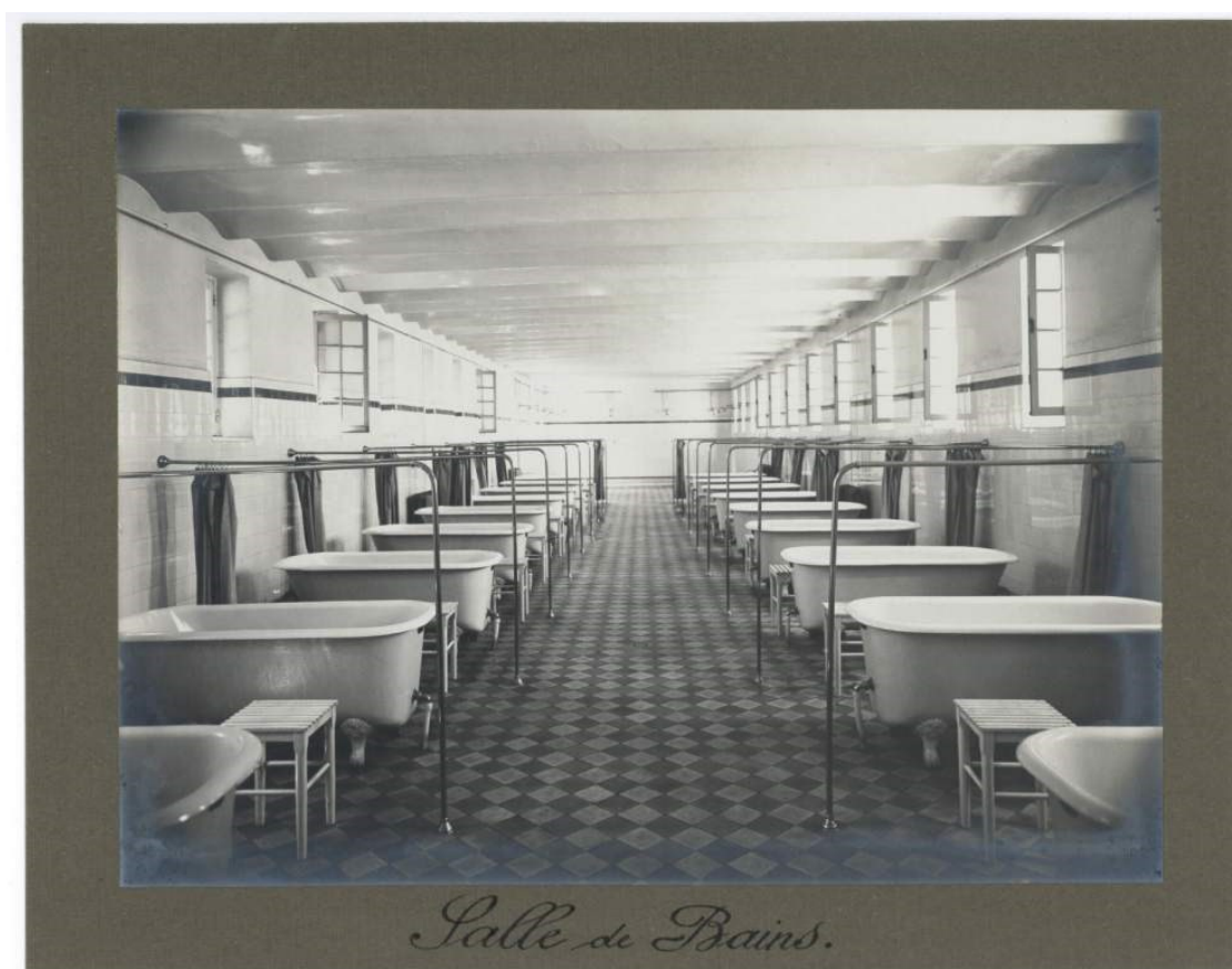
Crédit photo : Archives de l'Ordre de Saint-Jean-de-Dieu, salle de bains.