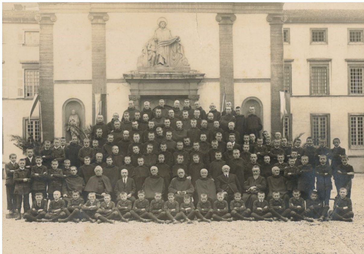
la communauté en 1924.