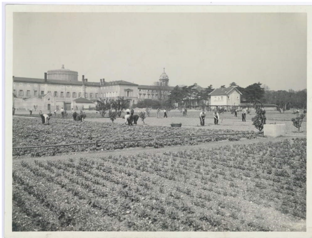
vue jardin.

Ce registre regroupe à la fois les achats de l'établissement pour des animaux et de quoi les entretenir, des légumes, du pétrole, des semences et autres vivres ainsi qu'une partie production indiquant ce qui a été produit dans les potagers de l'hôpital.