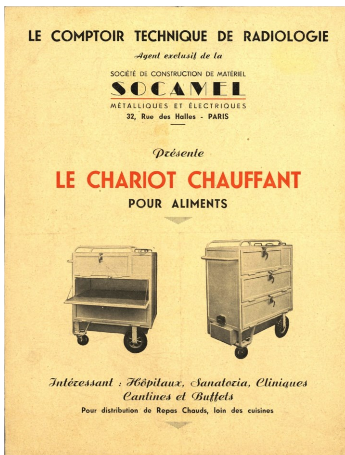
HDEPOT/SJDD O 31 Publicité pour des chariots chauffants.