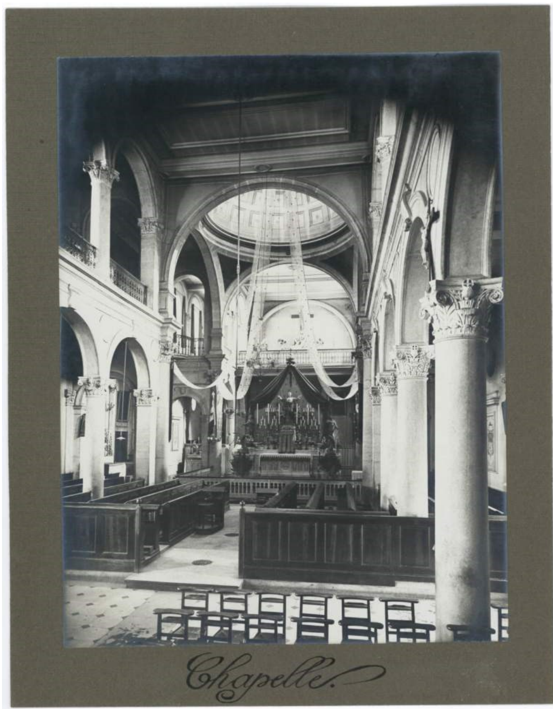
la chapelle, 1925.

HDEPOT/SJDD O 3 Bâtiment 2 : bureaux, réfectoire, infirmerie et cuisines.