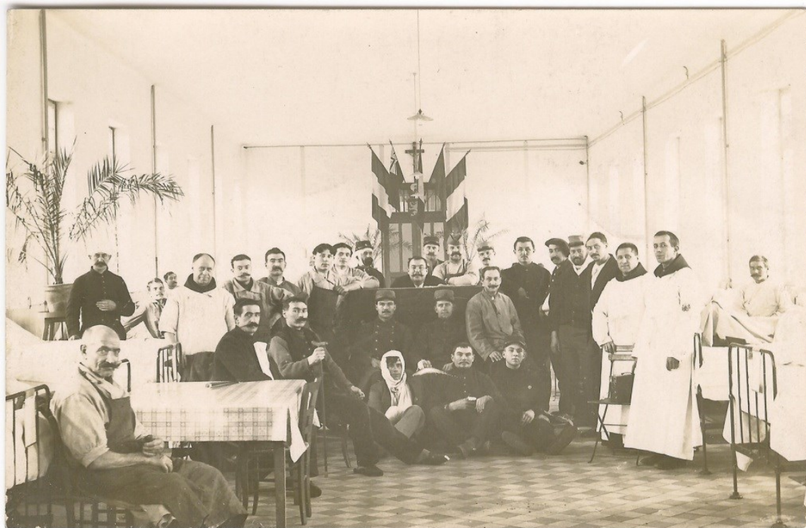
l'ambulance, 1 ère Guerre Mondiale.