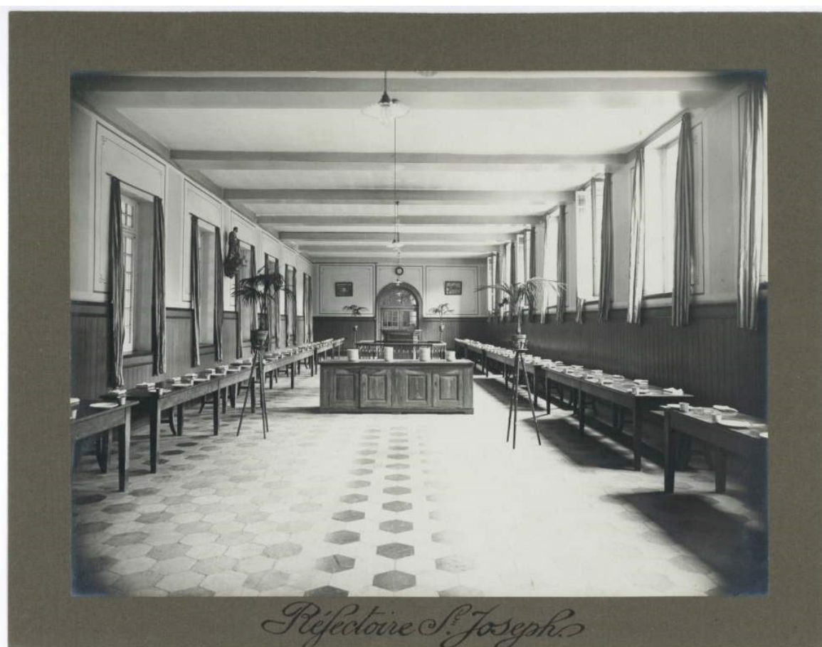
Crédit photo : Archives de l'Ordre de Saint-Jean-de-Dieu, réfectoire St Joseph, 1925.