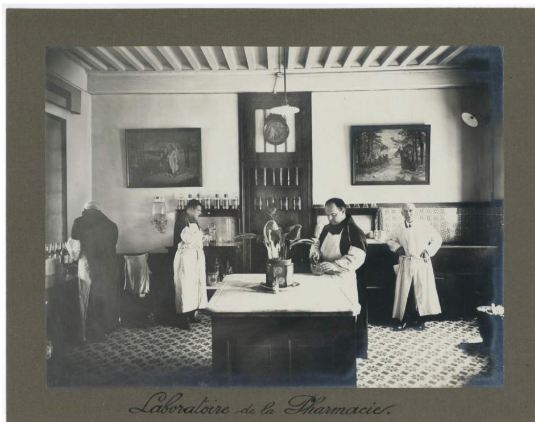
pharmacie, 1925.

HDEPOT/SJDD M 57-122 Frais d'hospitalisation.