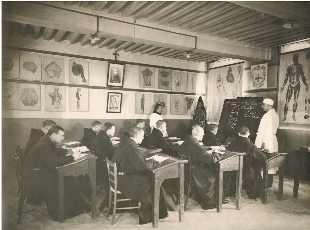
L'école d'infirmiers en 1936.

Les facultés de médecine manquent de corps pour les travaux pratiques d'anatomie et demandent aux hôpitaux la mise à disposition des corps des malades décédés et non réclamés par leurs familles.