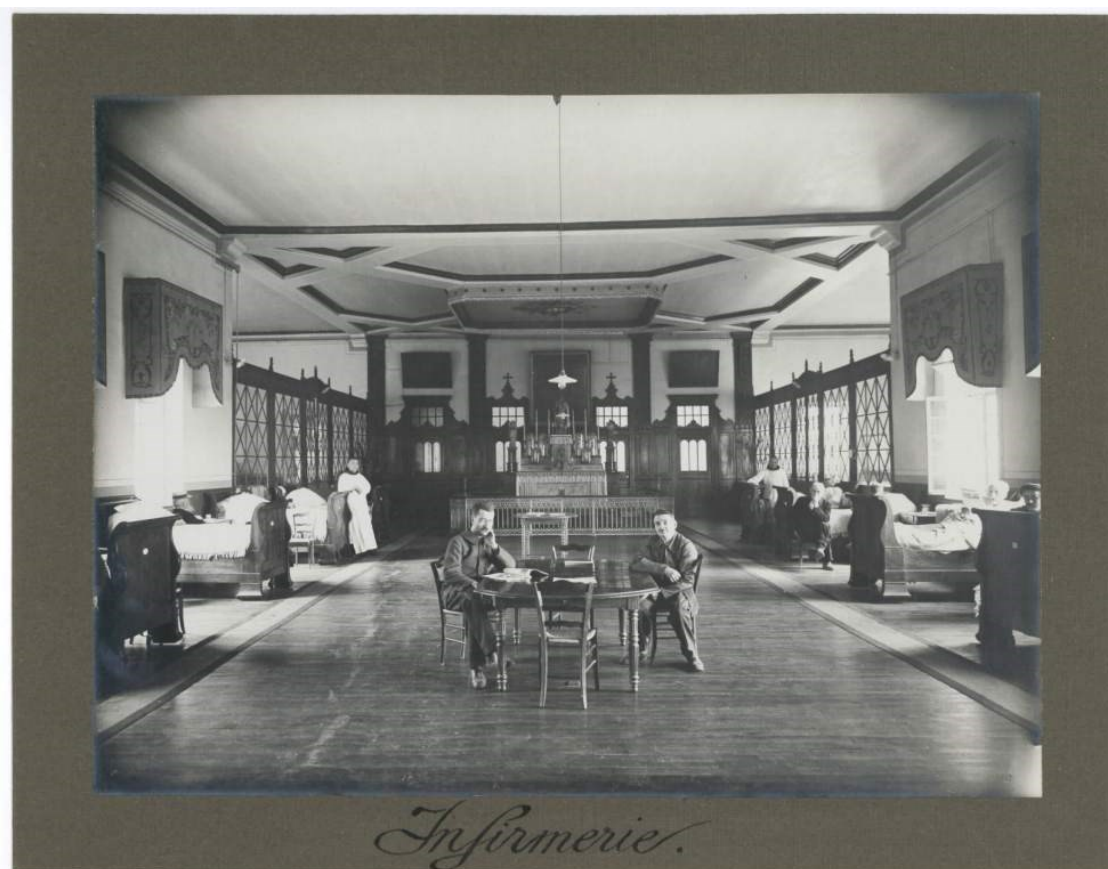
infirmerie, 1925