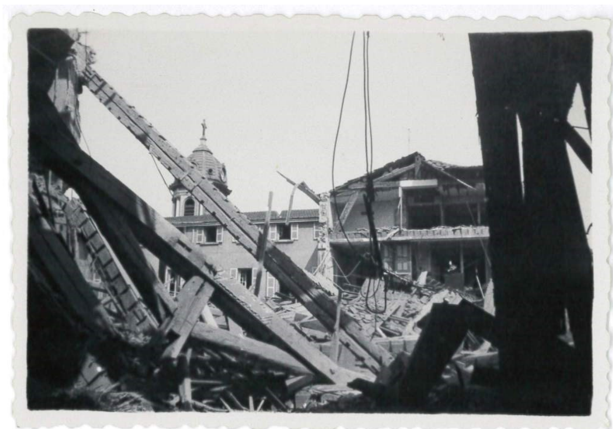
l'hôpital après le bombardement du 26 mai 1944.

Cela concerne les travaux engagés à la suite du bombardement du 26 mai 1944. Tous les bâtiments sont situés au 290 route de Vienne à Lyon, excepté la villa du docteur Carrier située au 144 route de Vienne et la villa du docteur Larrivé situé au 146 route de Vienne.