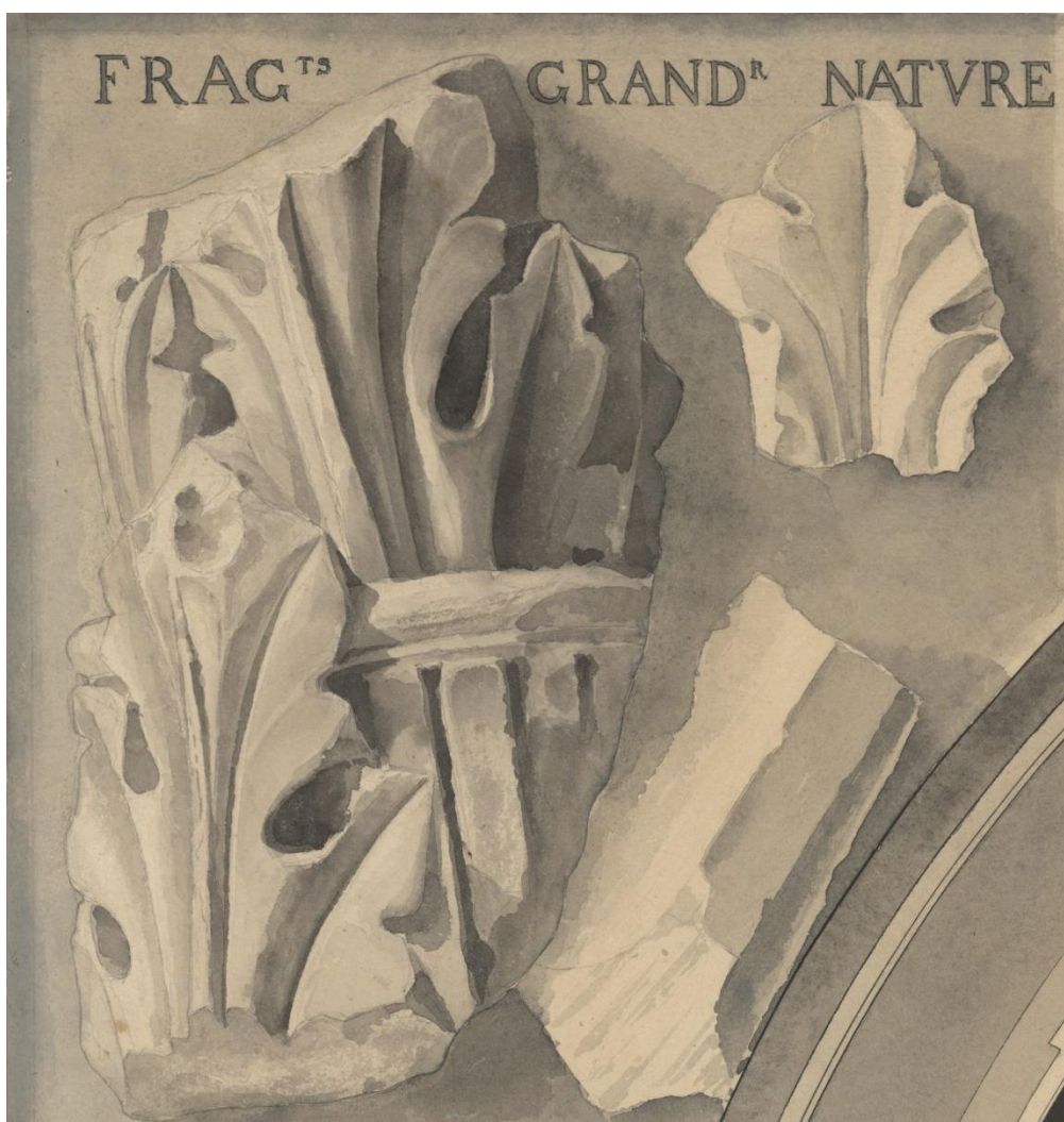
63Fi2 - détail