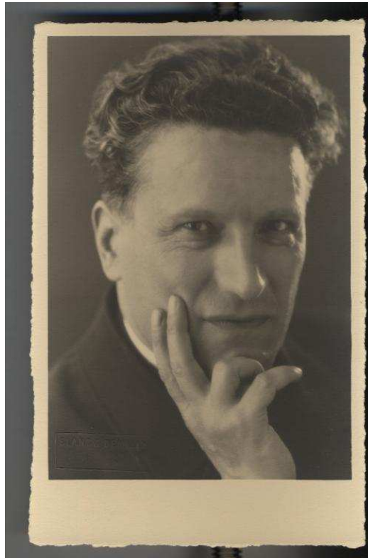
7 Fi 90, Monseigneur Joseph Lavarenne «offert gracieusement par la Maison Blanc et Demilly, 31, rue Grenette, Lyon, à l'Heure enfantine de Lyon-la-Doua pour ses œuvres », 16 x 11.5 cm.