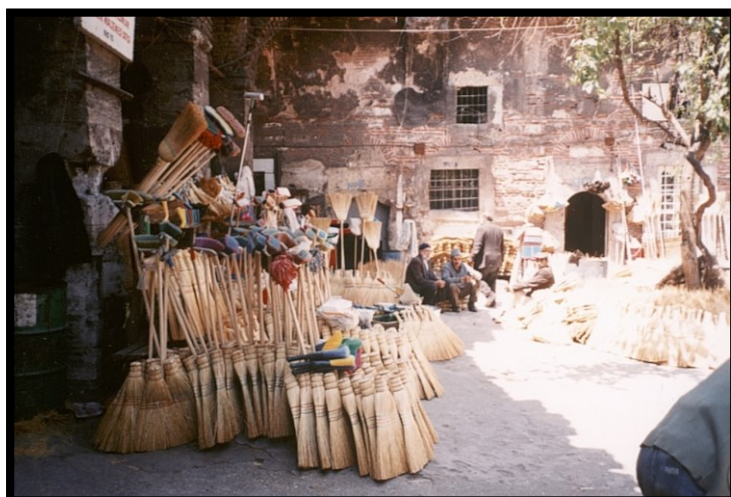
82Fi8 - Turquie