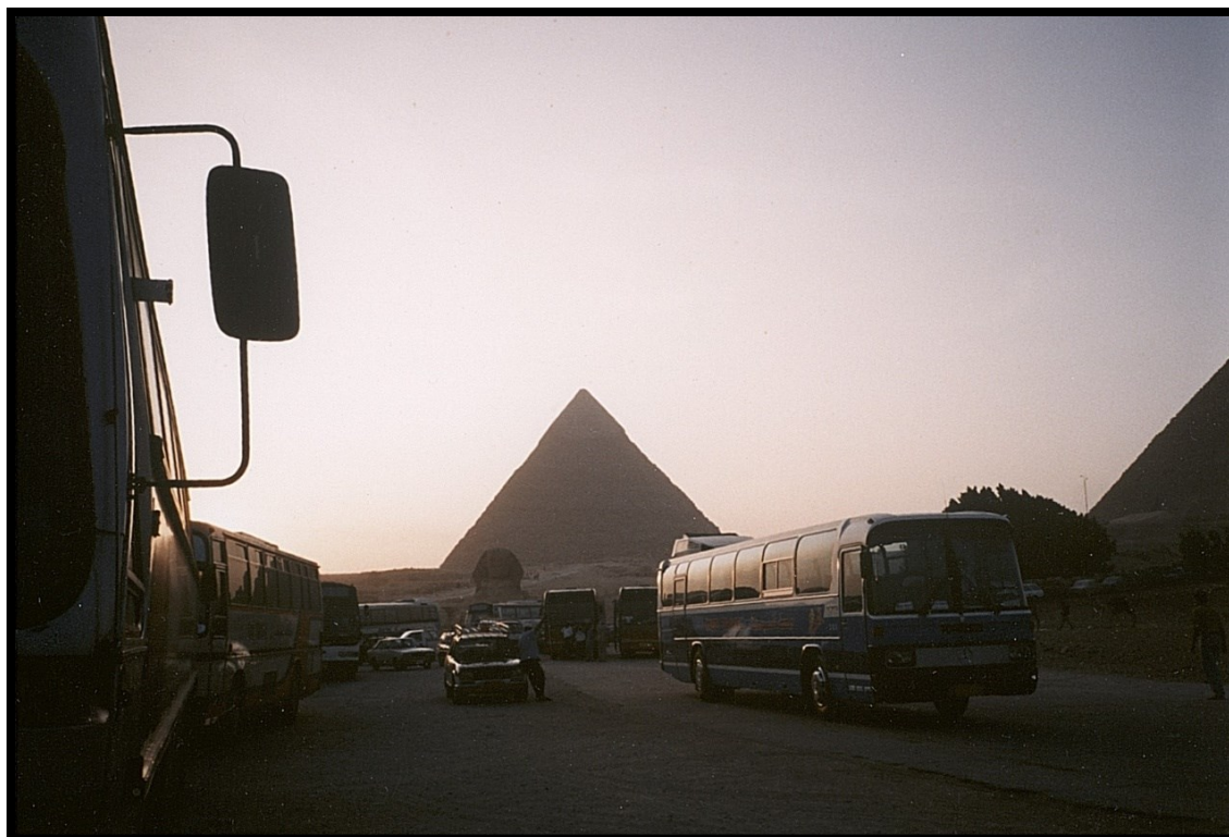
82Fi12 - Égypte