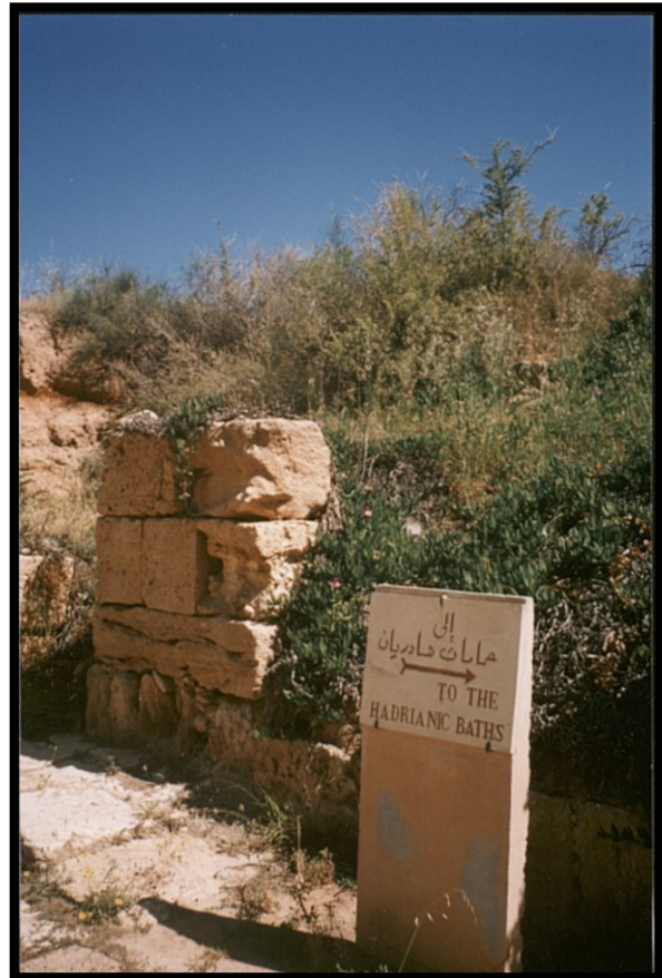
82Fi18 - Libye