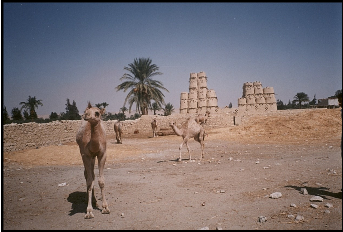
82Fi12 – Égypte