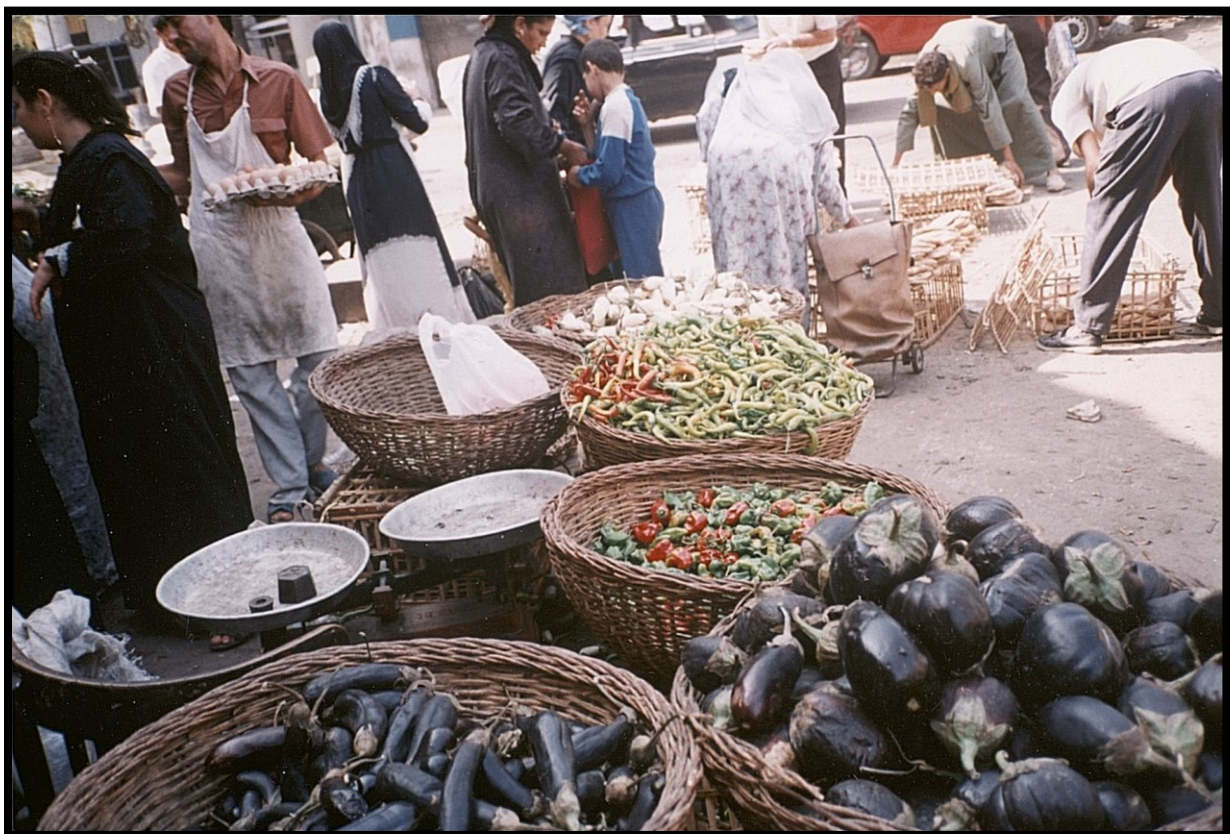
82Fi12 – Égypte