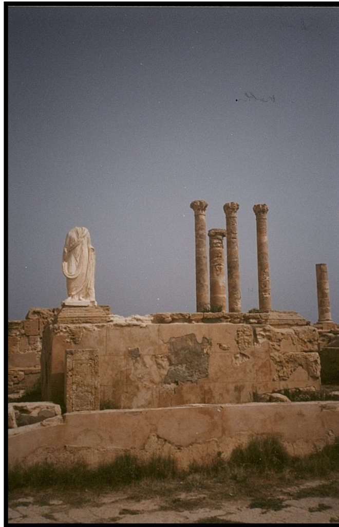
82Fi18 – Libye