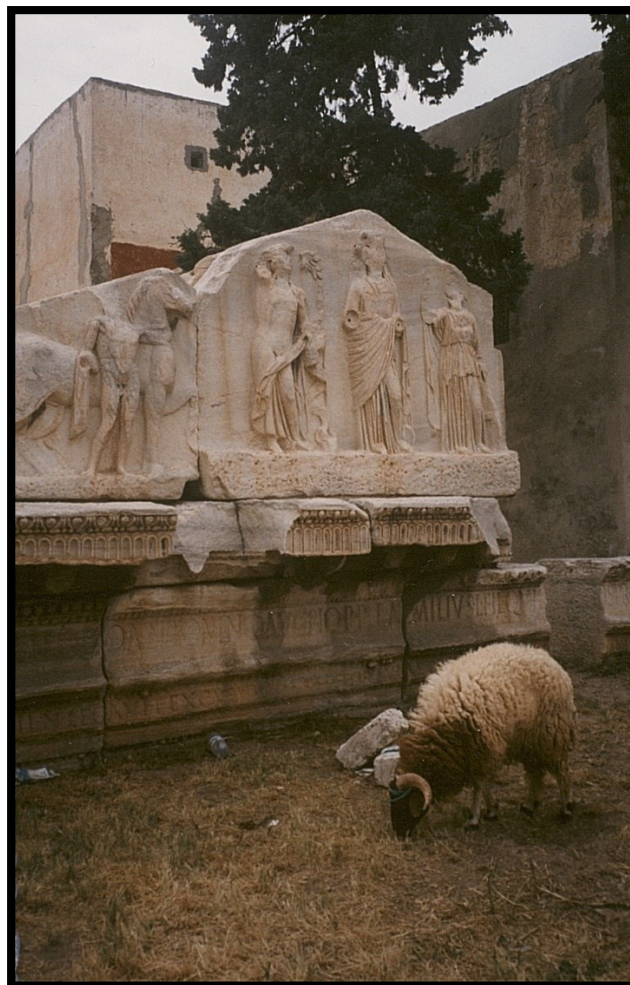
82Fi18 - Libye