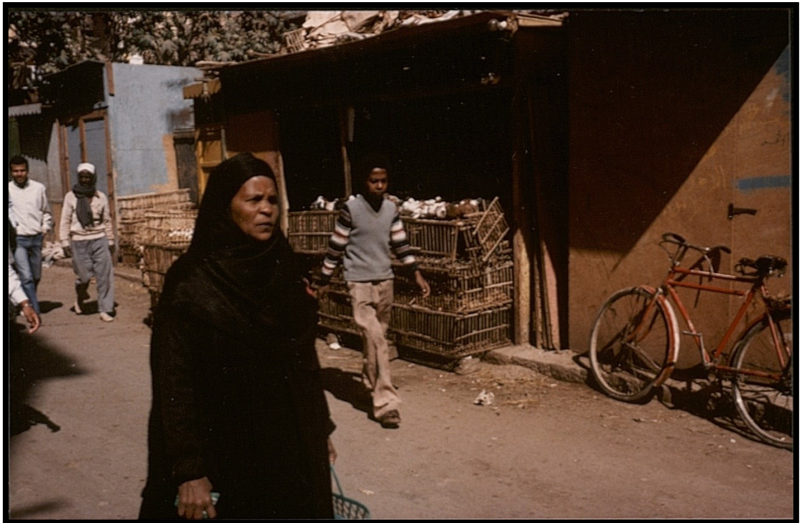
82Fi4 – Bazar d'Assuan (Égypte)