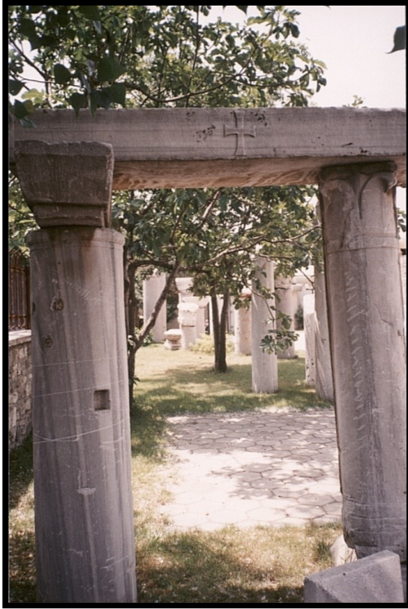
82Fi8 – Turquie