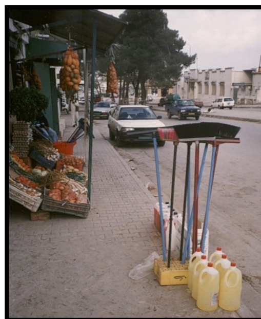
82Fi18 – Libye