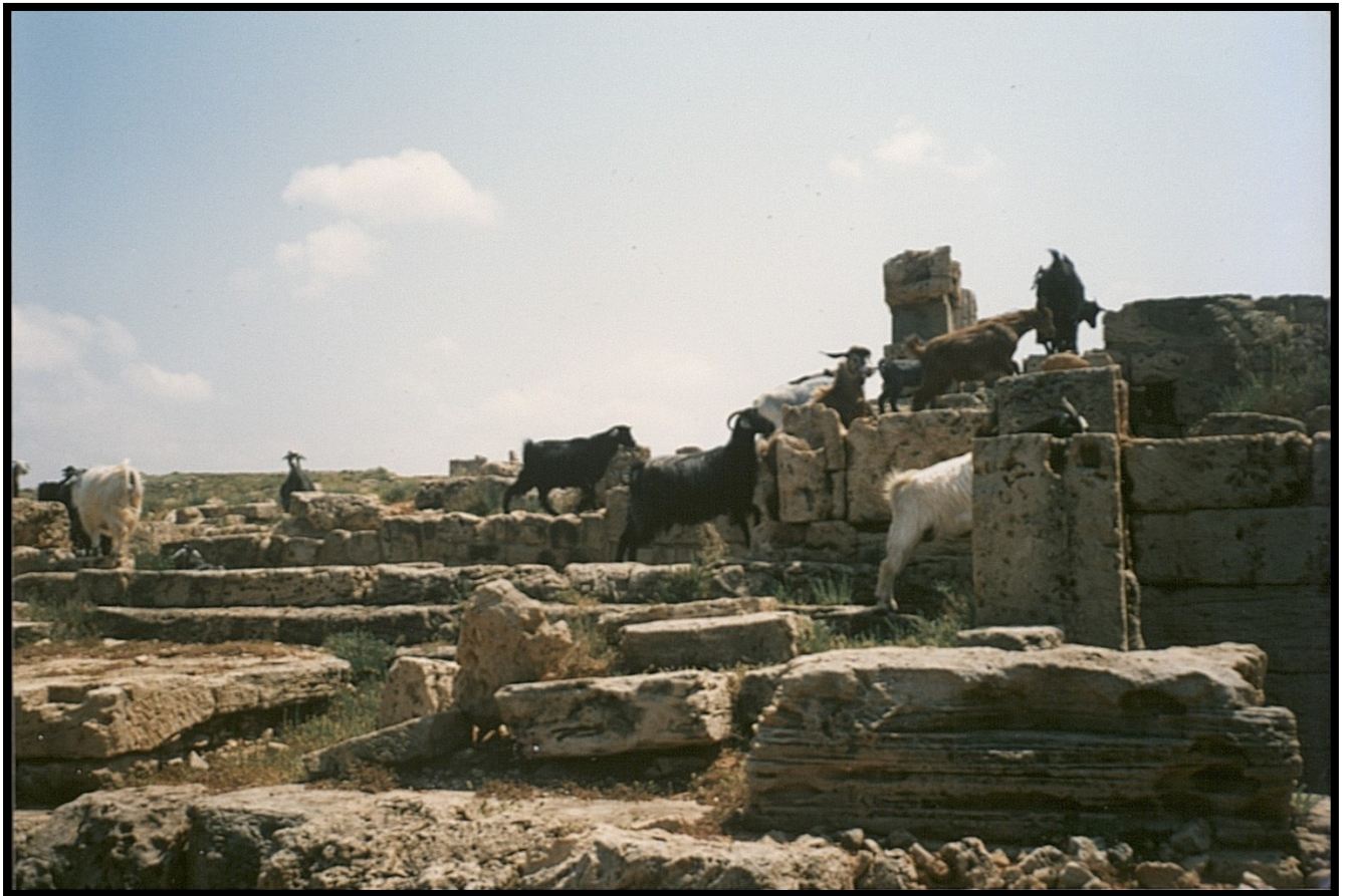
82Fi18 - Libye