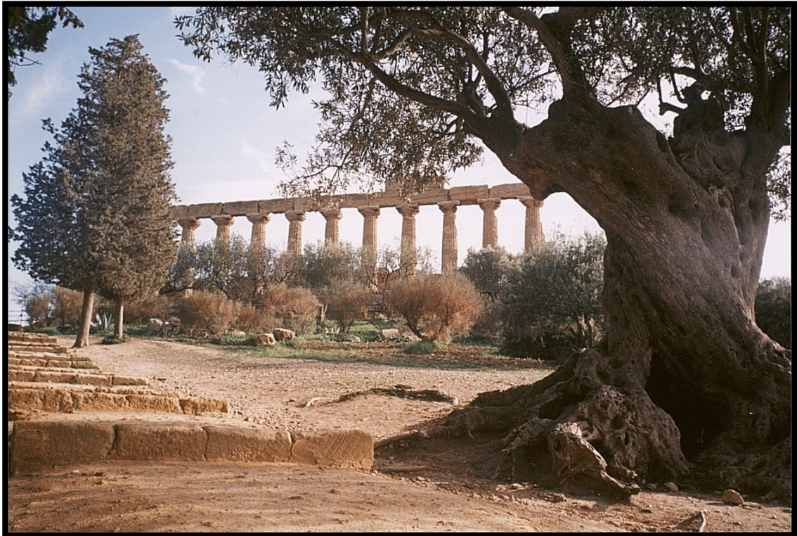
82Fi15 – Agrigente (Sicile)