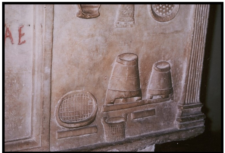
82Fi16 - Italie