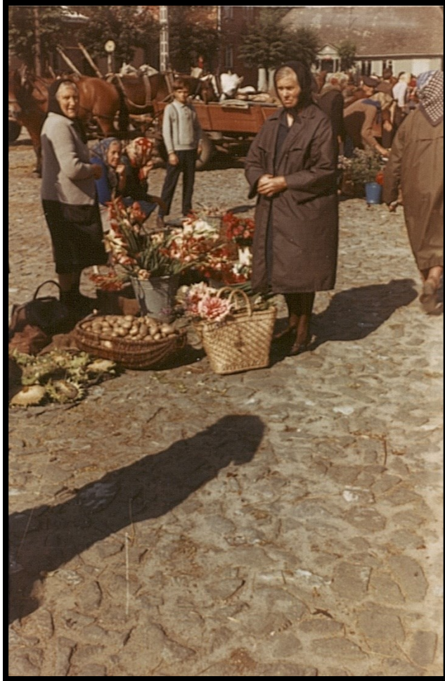
82Fi1 – Marché de Wielogóra (Pologne)