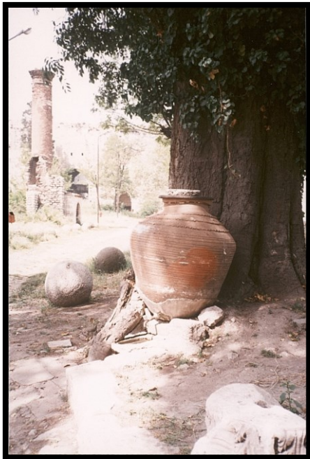
82Fi8 – Turquie