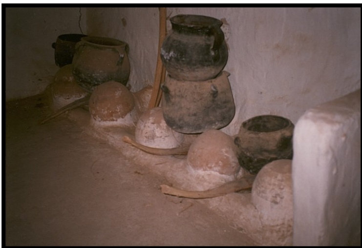
82Fi18 - Libye