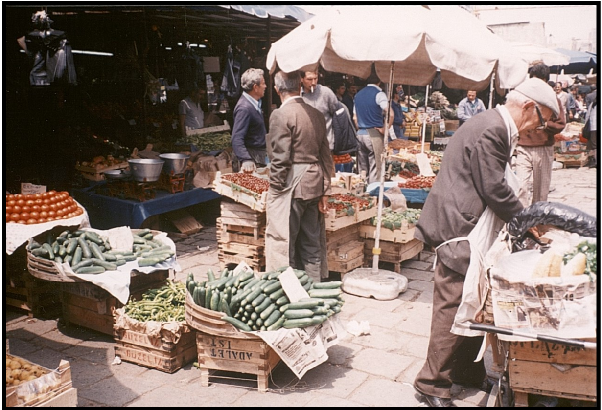
82Fi8 – Istanbul (Turquie)