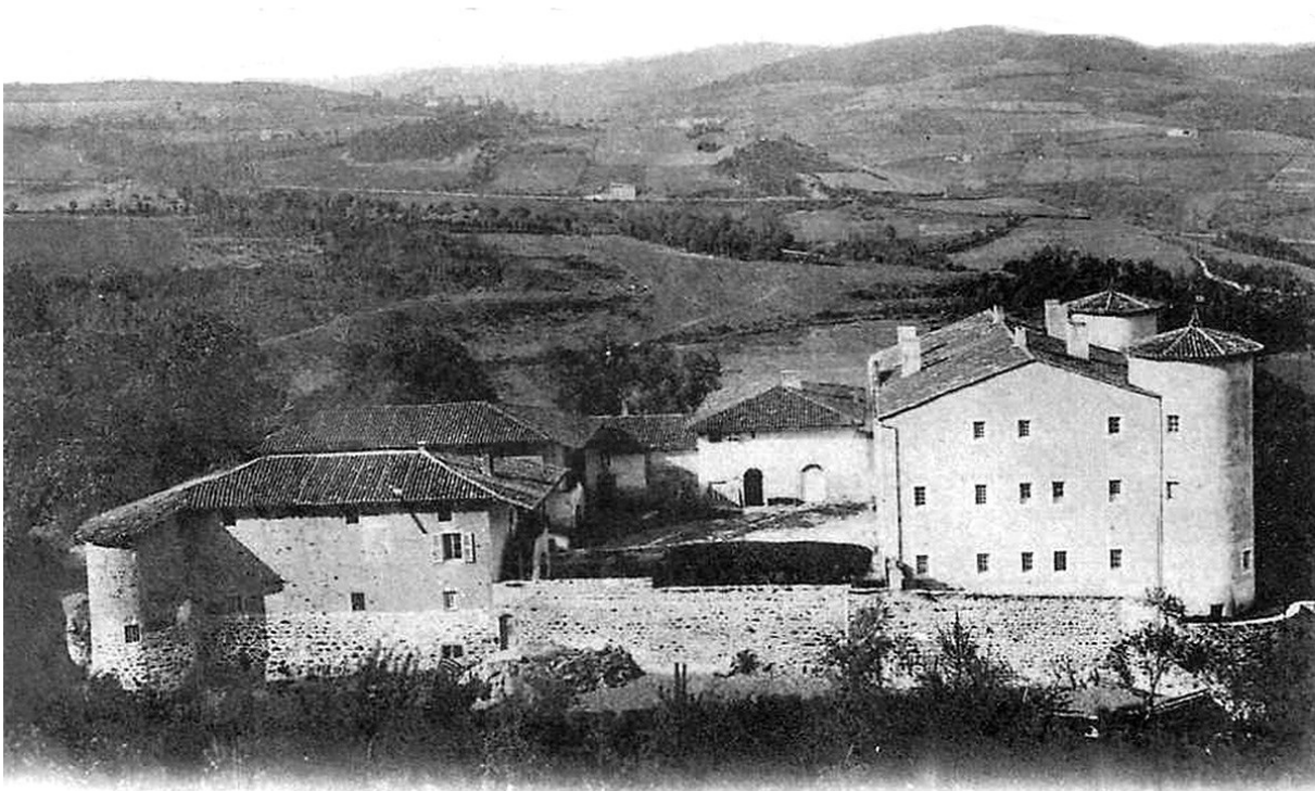
Environs de SAINT-MARTIN-EN-HAUT (Rhône). — Château de la Bâtie.

A servi de couverture « volante » au 460J200.