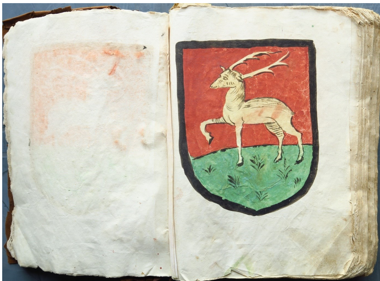
460J251 Liève de Montcellard, 1529, blason figurant en page de garde du registre